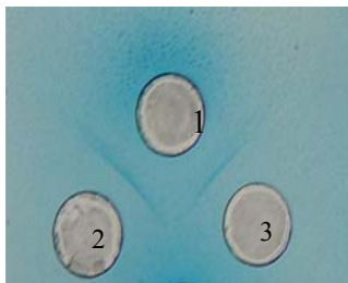
شکل ۳: آزمون ژل ایمنودیفیوژن چاهک شماره ۱: OMV خالص چاهک شماره ۲: Anti OMV Ab چاهک شماره ۳: Anti Neisseria meningitidis serogroup B Ab

سرم‌ها بعد از آماده‌سازی با استفاده از سرم فیزیولوژی استریل در رقت‌های مختلف به‌صورت سریالی داخل میکروپلیت پلی‌استری توزیع شد. به‌طوری که در هر خانه میکروپلیت ۲۵ میکرولیتر سرم (یا سرم‌های رقیق شده) قرار داده شد. به هر چاهک حاوی سرم، ۱۲/۵ میکرولیتر سوسپانسیون باکتریایی حاوی CFU/ml ۱۰۵ و ۱۲/۵ میکرولیتر سرم نوزاد خرگوش (به‌عنوان منبع کمپلمان خارجی) افزوده شد. بعد از اضافه نمودن سرم حیوان هیپرایمیون، سوسپانسیون باکتری CFU/ml ۱۰۵ و منبع کمپلمان خارجی (حجم کل ۵۰ میکرولیتر) به هر ویال میکروپلیت و مخلوط نمودن کامل آنها، ۱۰ میکرولیتر از هر چاهک به پلیت‌های مولر هینتون آگار منتقل و به مدت ۱۸ ساعت در دمای ۳۶±۱°C و فشار اتمسفری ۵ درصد CO 2 انکوبه شدند (T0). میکروپلیت حاوی ۴۰ میکرولیتر از مخلوط باقی مانده (باکتری، کمپلمان و سرم) به مدت یک ساعت در ۳۶±۱°C با فشار اتمسفری ۵ درصد CO 2 انکوبه گردید. پس از یک ساعت ۱۰ میکرولیتر از هر ویال به پلیت مولر هینتون آگار منتقل شد و تحت شرایط یکسان با پلیت‌های T0، به مدت ۱۸ ساعت انکوبه شدند (T1). پس از اتمام زمان انکوباسیون ۱۸ ساعته پلیت‌های T0 و T1 کلنی کانت شده و تعداد باکتری رشد یافته در T1 با T0 مقایسه گردید. عیار ما در هر سری، برابر با رقتی از سرم که تعداد کلنی‌های رشد یافته در زمان T1 کاهش یافته برابر یا بیشتر از ۵۰ درصدی را نشان دهد بود. کلیه سرم‌ها با سویه استاندارد CSBPI, G-245 سروگروه B نیسریا مننژیتیدیس به همراه کنترل، با تکرار سه بار مورد آزمون قرار گرفته و نتایج بررسی و ثبت شدند (۱۳ و ۱۴ و ۲۷ و ۲۹ و ۳۰).